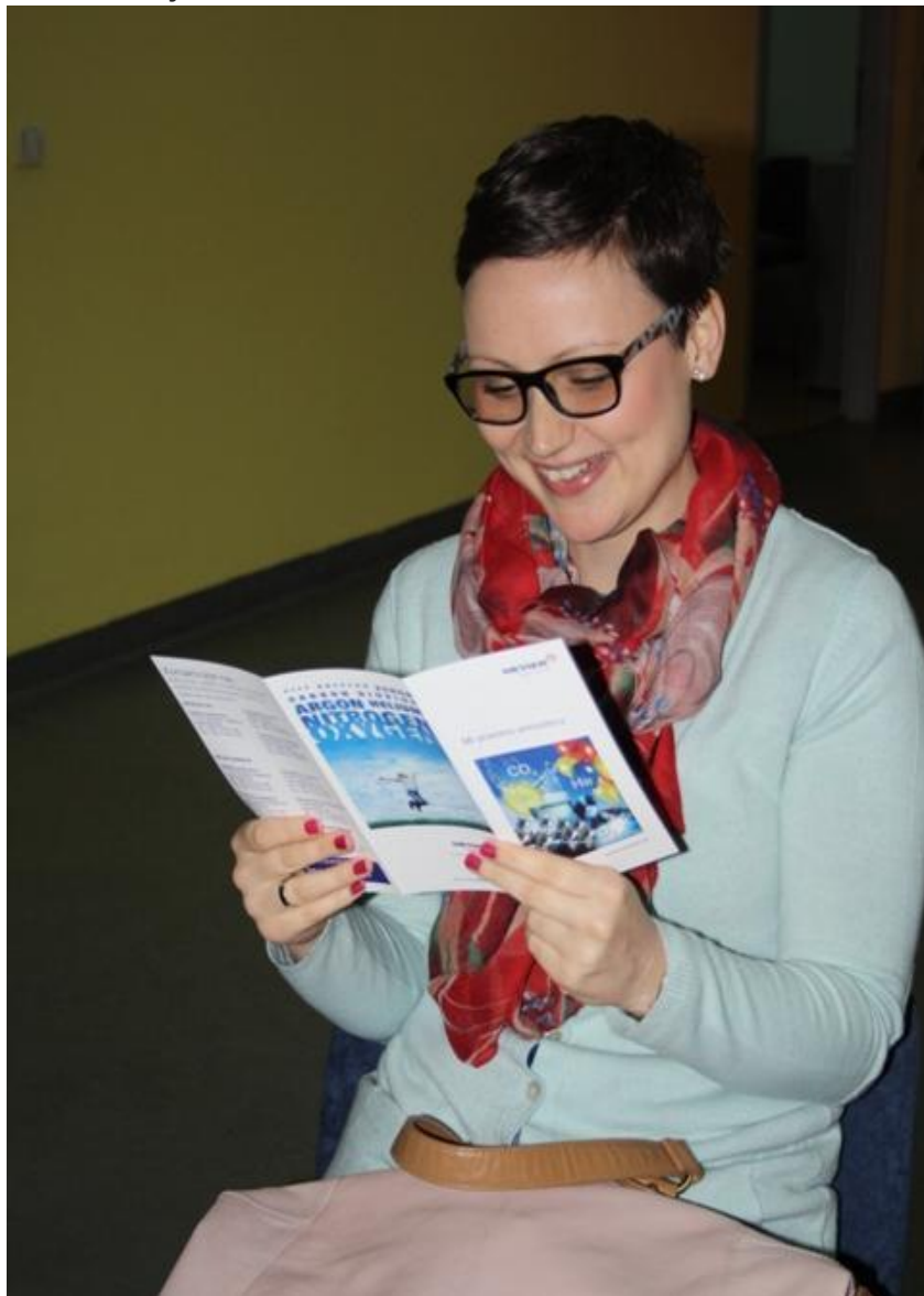
Messer osigurao nagrade za EUFOR-ov turnir

Kompanija Messer će u skladu sa svojom korporativnom politikom nastaviti podržavati razvoj nauke i implementaciju naučnih znanja u društveno korisne svrhe.